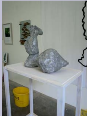
O. T., 2006/ 09 Aluminiumguss 2-teilig, 40 x 20 x 20 cm / 35 x 18 x 18 cm