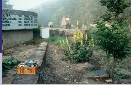
Gebiet II, Spiegelfabrik Gars am Kamp