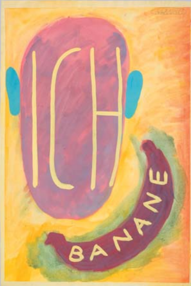
Peter Raital: „Ich Banane“, 1981, Kaseintempera/Papier, 79 x 53 cm, Inv.-Nr. 14825

Einerseits thematisiert die Schau die tradierte Vorstellung des Künstlers als „Außenseiter der Gesellschaft“, die sich etwa in der Selbststilisierung als Held, Märtyrer oder Exzentriker manifestiert. Andererseits geht es um die ewige Suche nach der eigenen Identität, die – wie zahllose Ich-Theorien großer Denker belegen – als unab-schließbarer Prozess gilt. Das Ich ist also ein hypothetisches Konstrukt oder mit den Worten des französischen Dichters Arthur Rimbaud (1854–1891) ausgedrückt: „Es ist falsch zu sagen: Ich denke. Man müsste sagen: Ich werde gedacht [...] Ich ist ein anderer.“