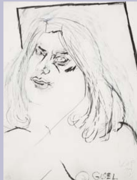
Karl Anton Fleck, „Gisel“, 1974, Bleistift/Papier, 65 x 50 cm, Inv.-Nr. 9625