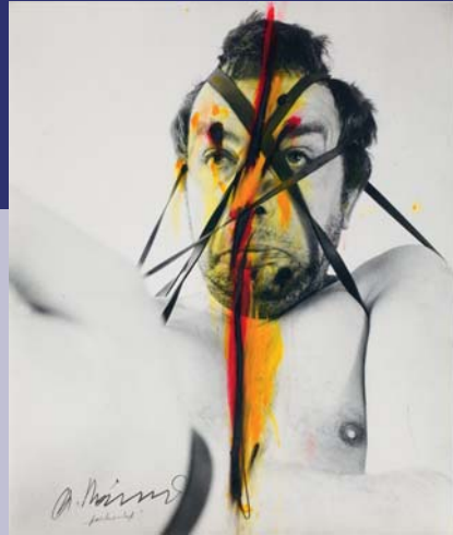
Arnulf Rainer „Formenhaft“ (aus der Serie: „Face Farces“), 1972, Ölkreide, Tusche/ Fotografie, 60 x 50 cm, Inv.-Nr. 15219

Eröffnet wird dieser bunte Reigen von „Ich-Ikonen“, der sich auf die Zeit ab 1950 konzentriert, von Egon Schiele, der als einer der ersten modernen „Outcasts“ neben Rimbaud die zweite große Symbolfigur der Ausstellung darstellt.