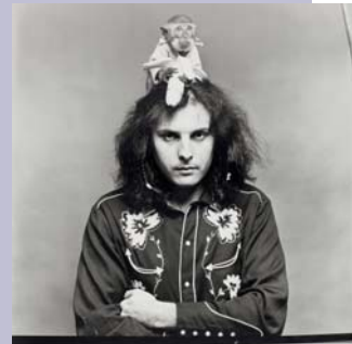
Christian Skrein: „Attersee“, 1968, Silbergelatine/Barytpapier, 50 x 40 cm, Inv.-Nr. 10863/4